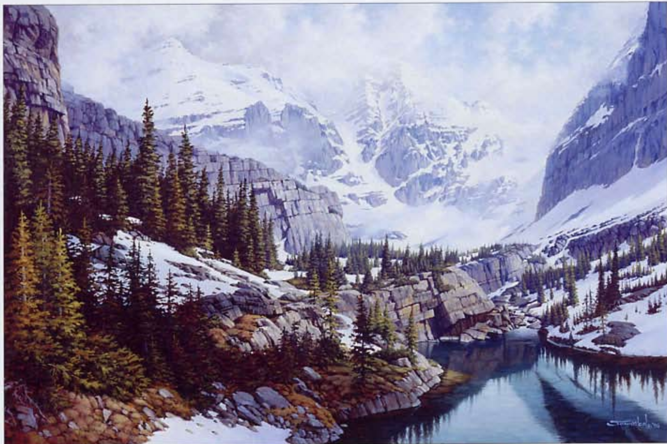
◎雾中乐土 (Misty Elysium) 帆布油画 16×24 英寸 1998 冰川覆盖的玫瑰环峰与维多利亚湖 幽侯国家公园, 幽侯国家公园, 加拿大不列颠哥伦比亚省