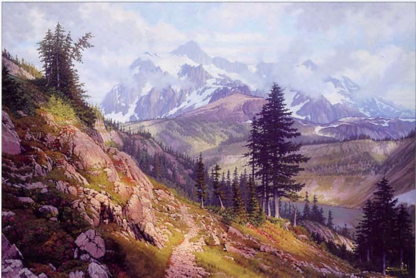
● 薄雾中的卡斯卡德斯北部山脉 (Mist in the North Cascades) 帆布油画 24×36 英寸 2006