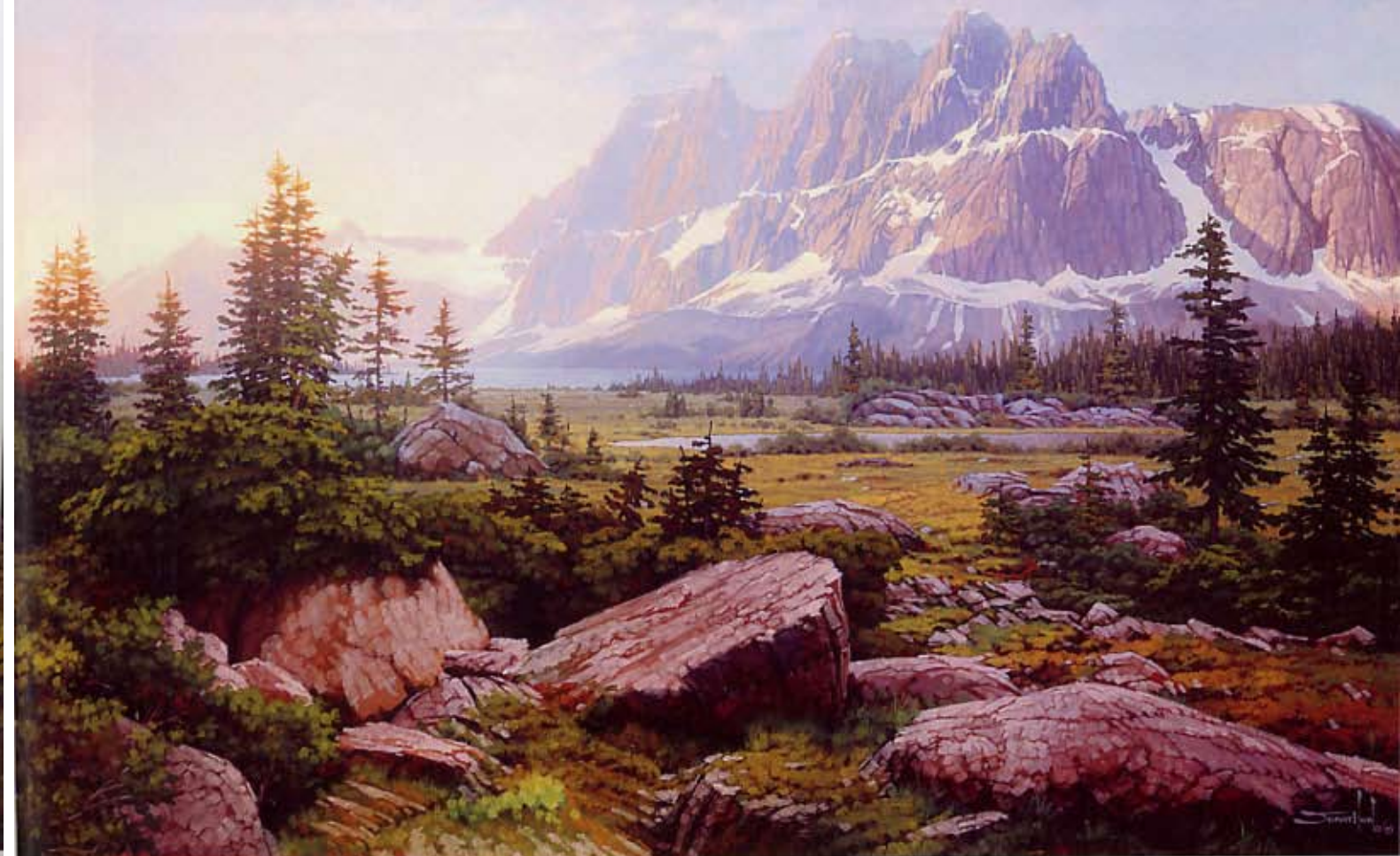
▲ 壁垒山的日出 (Sunrise at the Ramparts) 板上油画 20×30 英寸 2005 壁垒山和安姆斯特湖 碧玉国家公园, 加拿大艾伯特省