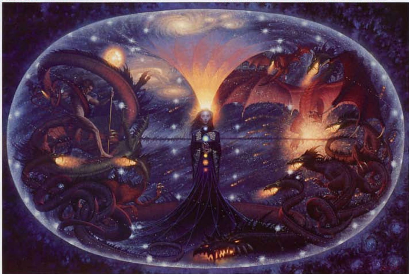
③ 帕西瓦尔的挽歌 (Parsival's Lament) 亚麻布油画 30×46 英寸 2003