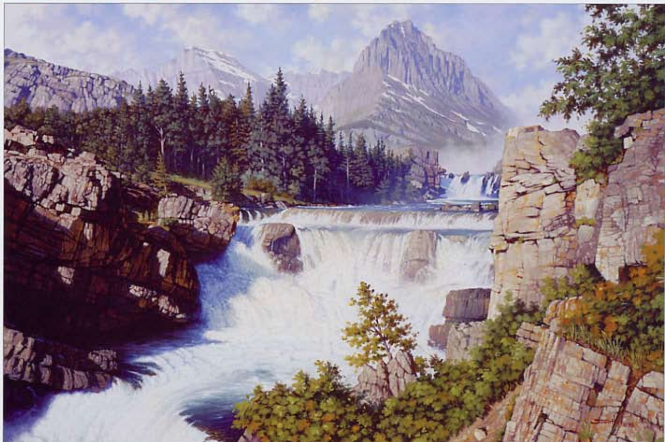
❷ 奔流涌雷 (Swiftcurrent Thunder) 帆布油画 16×24 英寸 1998 美国蒙大纳国家冰川公园