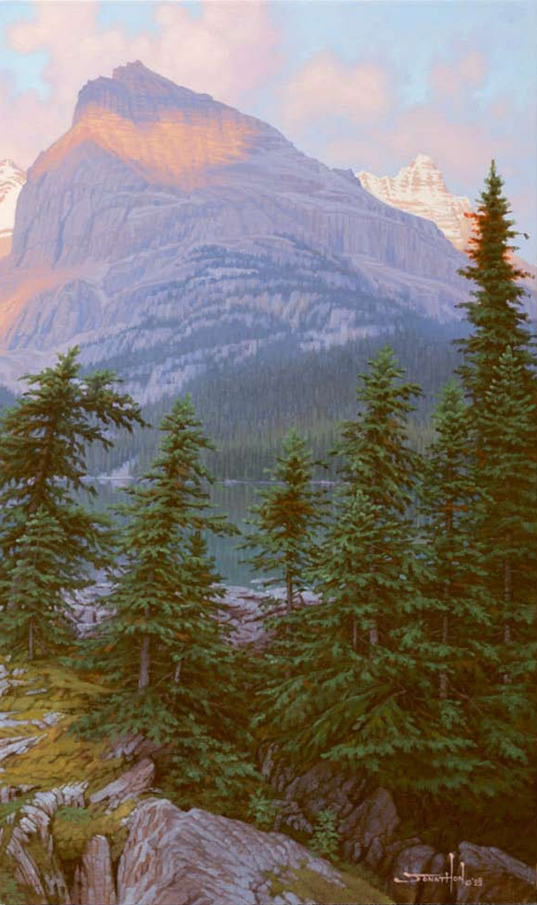
● 瓦尔哈拉殿堂的闪光 (Valhalla Gleaming) 帆布油画 24×36 英寸 2008 鲍勃阿诺

即 便细小如同我们般的存在，也蕴含着一个世界。于是有的人把目光投向了自身，他们希望能在自己身上找到这个世界的真理，他们成了人类学家、社会学家。而有的人把目光投向我们身边的东西，他们成了物理学家、生物学家，还有的人把目光瞄准了那些我们不可触摸的外空间，他们成了天文学家。而还有一些人他们观察着，思索着，总结着，并希望借此能够一窥世界的本原，他们成为了哲学家。而另一群人则把所有的一切都寄托在一个伟大的存在身上，他们最终成为了神学家。除此之外，还有这么一群人，他们观察着这个世界上的一切，他们思索着他们所观察到的一切，并最终把他们所观察的和思索的通过某种形式表现出来，他们就是艺术家。