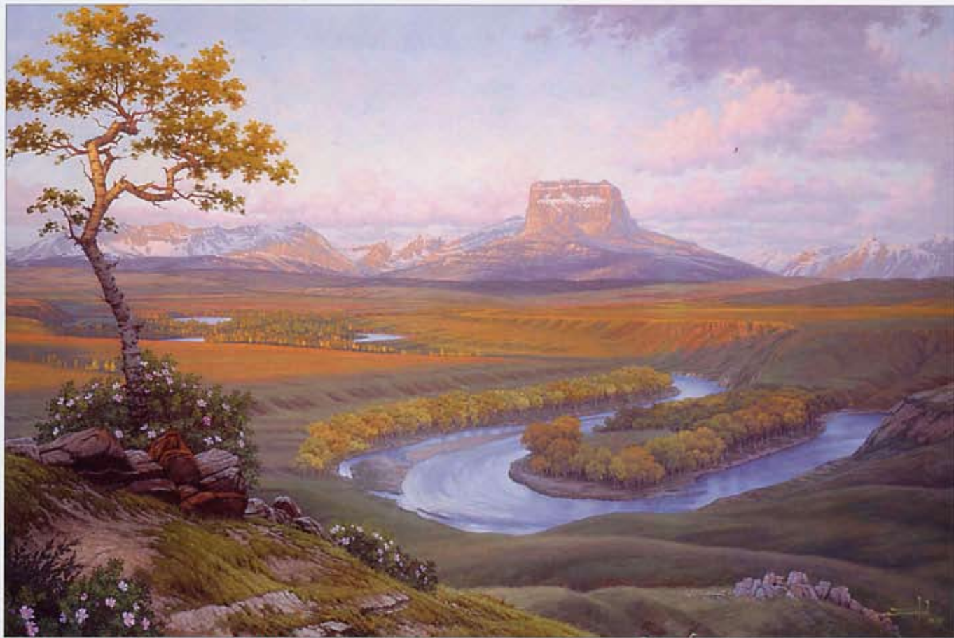
❶ 酋长山的破晓 (First Light on the Chief) 帆布油画 30×46 英寸 2005 酋长山与玛丽河 艾伯特南部和蒙大纳北部交界