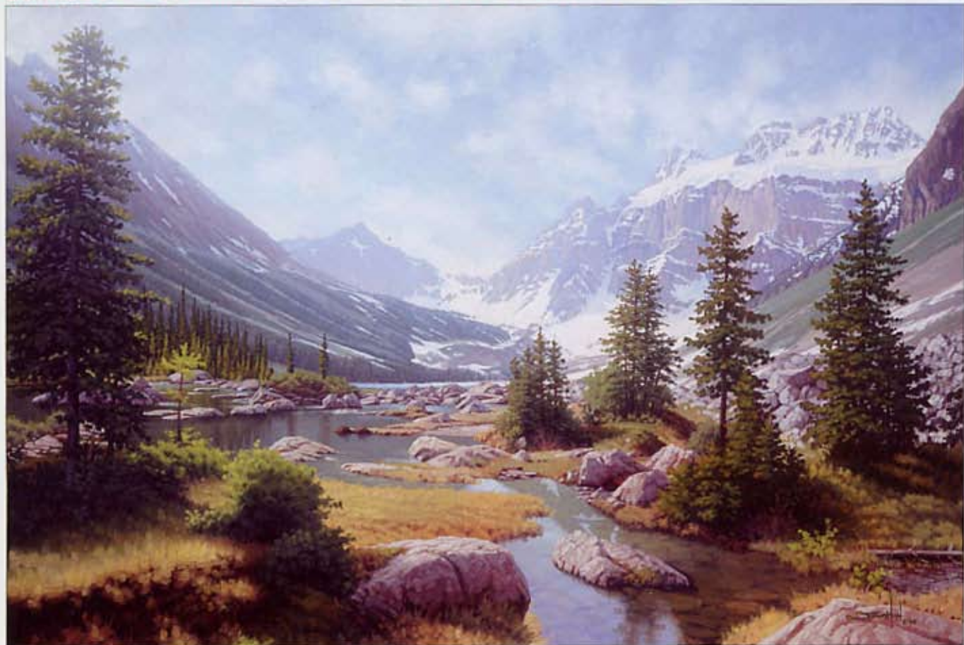
◎ 晨间的慰藉谷 (Morning Consolation) 板上油画 20×30 英寸 2005 慰藉谷, 班非国家公园, 加拿大艾伯特省