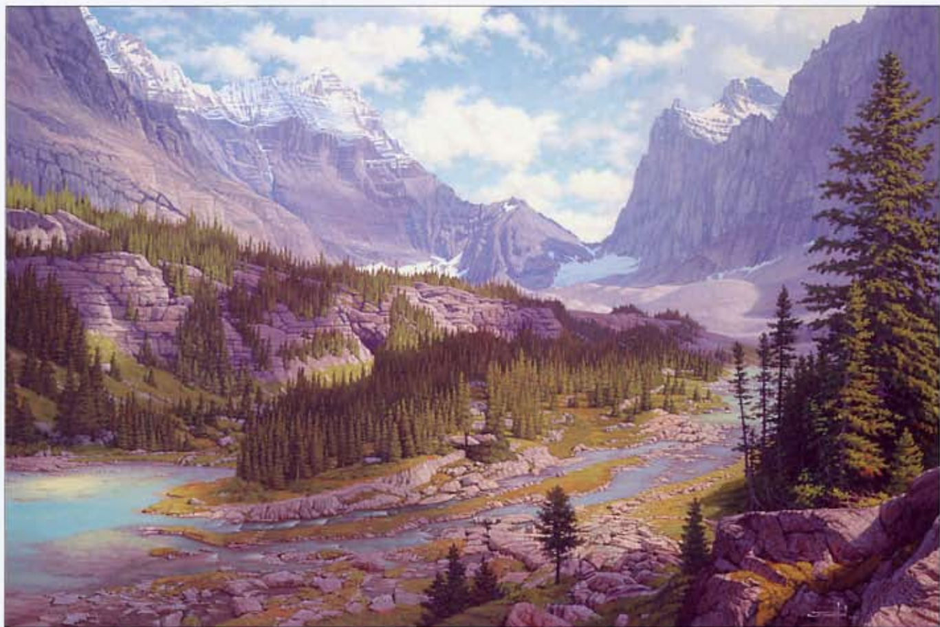
● 奥帕宾的光之舞 (Opabin Light Dance) 帆布油画 20×30 英寸 2007 映哈阿湖, 幽候国家公园, 加拿大不列颠哥伦比亚省 映哈阿湖