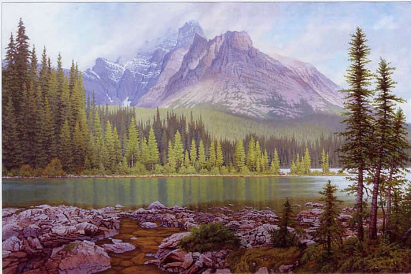
◎ 薄雾中的大教堂山 (Cathedral in the Mist) 帆布油画 24×36 英寸 2008 大教堂山和湖 幽侯国家公园, 加拿大不列颠哥伦比亚省